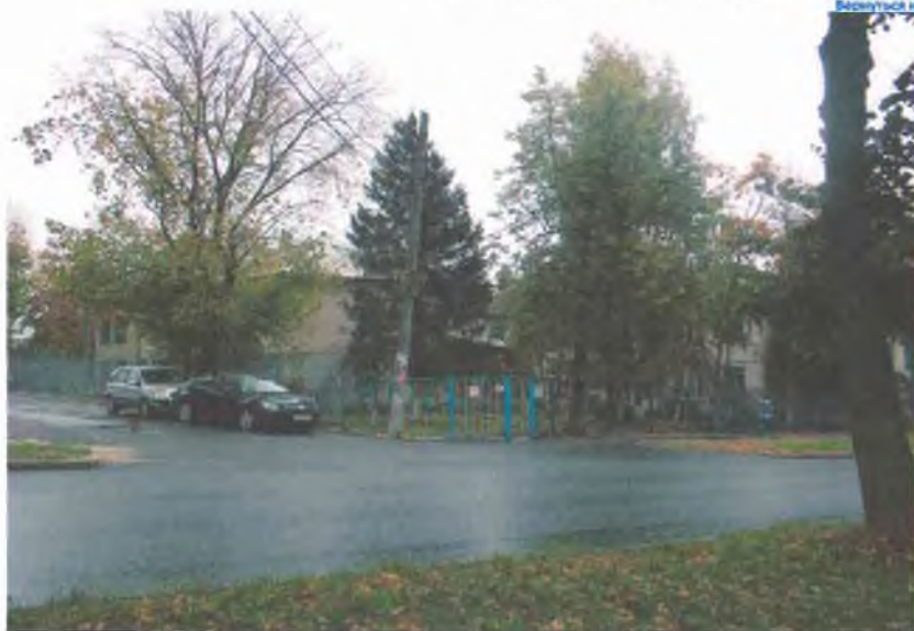
ул. Степана Разина, дом 57